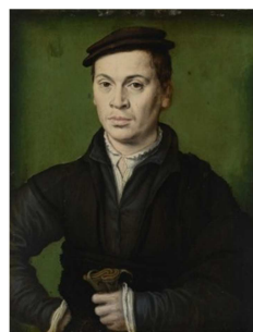
L'Homme au bérêt noir tenant une paire de gants.